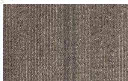
005 - Leo