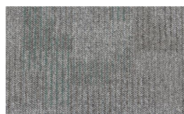
054 - Steel