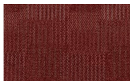
061 - Furnace