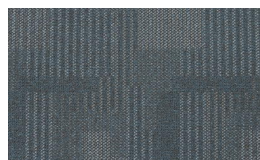
059 - Laguna