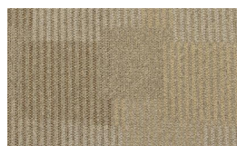
055 - Fancy