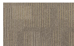
057 - Savana