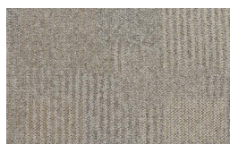
056 - Native